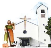
St. Josef Rappenbügl

06. - 20. Januar 2019 Pfarrelengemeinschaft Maxhütte-Haidhof/Rappenbügl