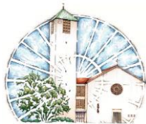
St. Barbara Maxhütte-Haidhof